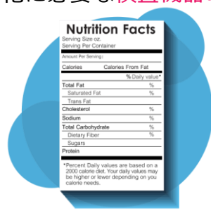
輸出向け栄養成分 表示のための分析