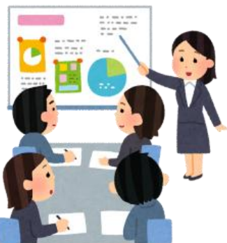
集合研修の受講、開催