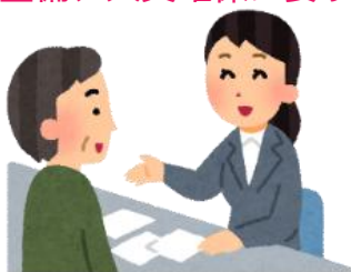
証明書発行等業務の人員増強