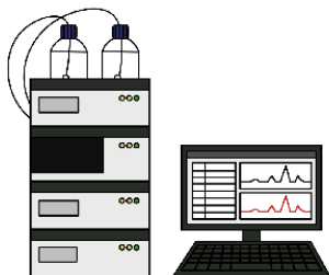
高速液体クロマト グラフ質量分析計