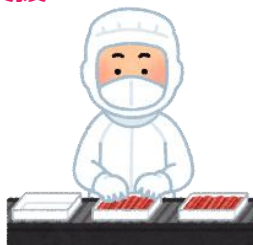
施設認定、審査体制の整備